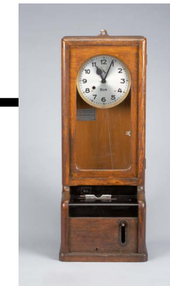
Stempeluhr, Württembergische Uhrenfabrik Bürk, Schwennigen am Neckar, 1950–1969