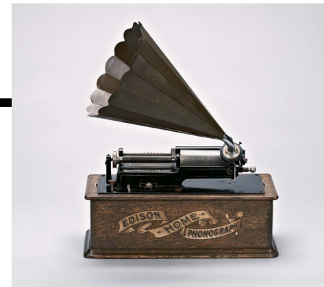
Walzenspieler „Edison Home Phonograph“, Köln, 1904

Natur Auf der ersten Ebene „Natur“ gliedert sich die Präsentation der Geologischen Sammlung in die Bereiche „unbelebte Natur“ mit Rohstoffen, Mineralien und Gesteinen und „belebte Natur“, also Fossilien, angefangen von Bakterien-Kolonien über Pflanzen bis hin zu Wirbeltieren. Neben Riesenkristallen, Großammoniten, einem Baumriesen und der Meeresreptilienwand werden auch ganz bedeutende Einzelsammlungen, wie die Wuppertaler Fuhlrott-Sammlung mit dem ungewöhnlichen Donnerpferd und Teile der Vester-Pflanzensammlung mit ihren Trocken- und Feuchtpräparaten öffentlich sichtbar. Eines der Highlights ist sicherlich die Präsentation der umfangreichen Ammonitensammlungen des Museums.