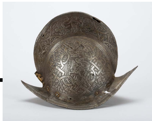
Paradehelm (Morion), Norditalien, um 1580/90