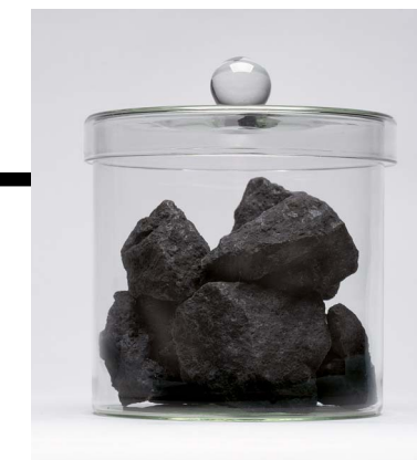
Bleierzschlacke, Nordrhein-Westfalen, Ruhrgebiet, Essen-Frintrop

Geschichte Die besonders sehenswerte Abteilung Industrie- und Zeitgeschichte vor allem des Ruhrgebiets, die sich auf der unteren Ebene „Geschichte“ befindet, teilt die Objektwelten weniger nach ihrer Materialität, sondern mehr nach inhaltlichen Aspekten ein. Neben Bereichen wie Alltag, Freizeit, Haushalt, Warenwelt und Handwerk warten die Hinterlassenschaften von Bergbau, Eisen und Stahl ebenso wie die Phänomene Religion, Krieg, Repräsentation und Kindheit. Während des gesamten Rundgangs entstehen durch die offene Architektur nicht nur Nahperspektiven auf die Objekte, sondern inspirierende und Neugier weckende Fernperspektiven auf die Sammlungsbestände der anderen Ebenen, die neue Einblicke und überraschende Zusammenhänge der Sammlungen und ihrer Geschichte offenbaren.