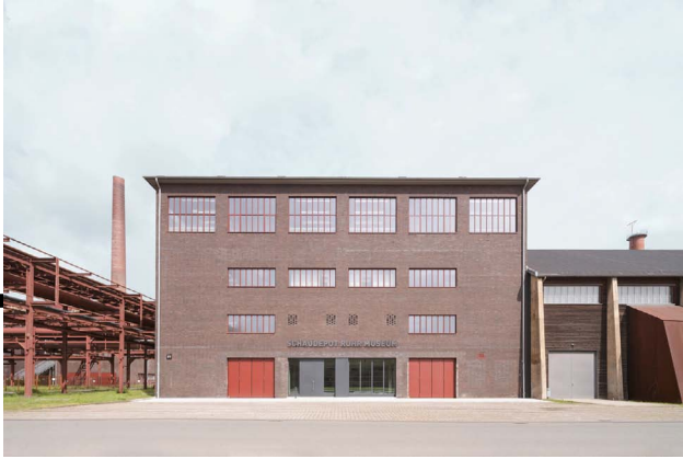
Außenansicht des Schaudepots des Ruhr Museums auf der Kokerei Zollverein