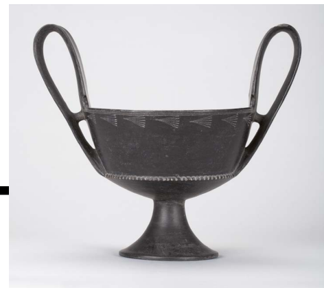
Etruskischer Bucchero-Kantharos, Vulci, 630–575 v. Chr.

Kultur Auf der mittleren Ebene „Kultur“ mit den Bereichen Archäologie, Mittelalter und Vormoderne sorgt eine umfangreiche Schau- und Studiensammlung von über hundert Schädelrepliken eindrücklich für den Übergang von der Natur- in die vom Menschen geprägte Kulturgeschichte. Die Schädel stehen für mehr als zwei Millionen Jahre Menschheitsgeschichte. Darüber hinaus veranschaulichen eine große Anzahl an vor- und frühgeschichtlichen Ton- und Glasgefäßen sowie an Objekten aus Holz, den Eindruck der typischen materiellen Zusammensetzung einer archäologischen und vormoderne Sammlung. Sie gliedern die Ebene in die Abteilungen Keramik, Glas, Stein und Möbel, Hausrat, Landwirtschaft und Handwerk – von den antiken Hochkulturen vor tausenden von Jahren bis in die Frühe Neuzeit vor der Industrialisierung.