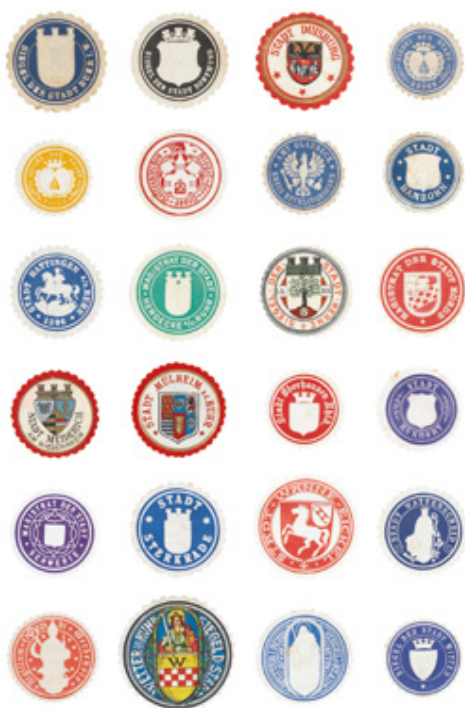
24 Siegelmarken von Ruhrgebietsstädten vor der Eingemeindung 1914