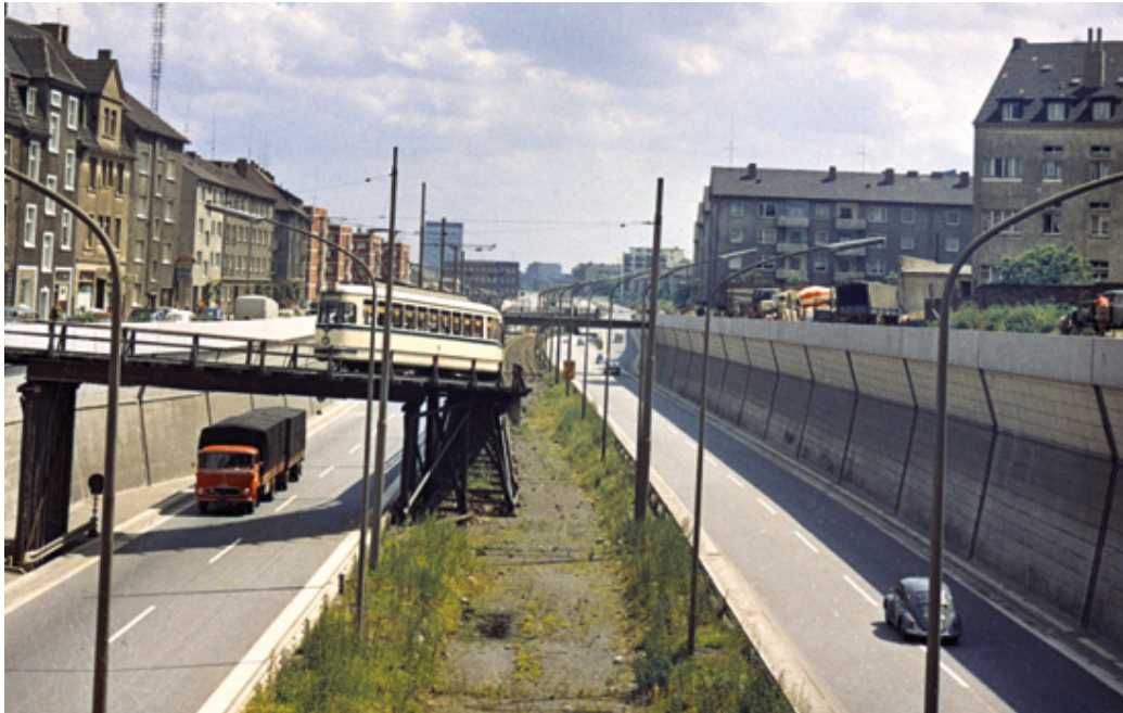
Der Ruhr Schnellweg im Ausbau zwischen Mülheim und Essen, um 1960