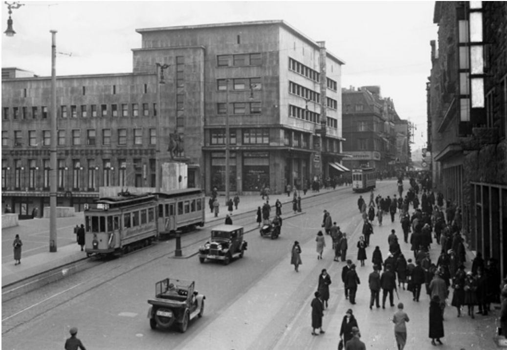
Blick auf die Lichtburg in Essen, um 1930