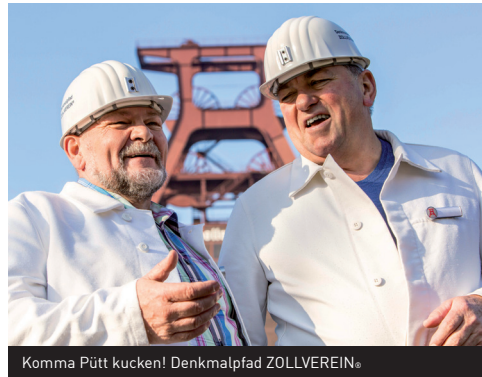
Komma Pütt kucken! Denkmalpfad ZOLLVEREIN®

Orientierung, Karte, Navigation, Kalender und Infos zu Veranstaltungen (kostenlos im Apple App Store / Google Play-Store)