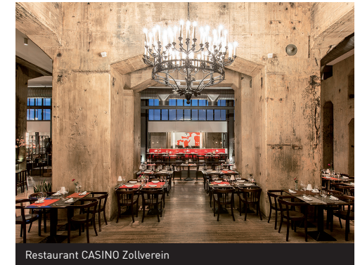
Restaurant CASINO Zollverein

Interaktive Ausstellung mit mehr als 120 Experimentierstationen