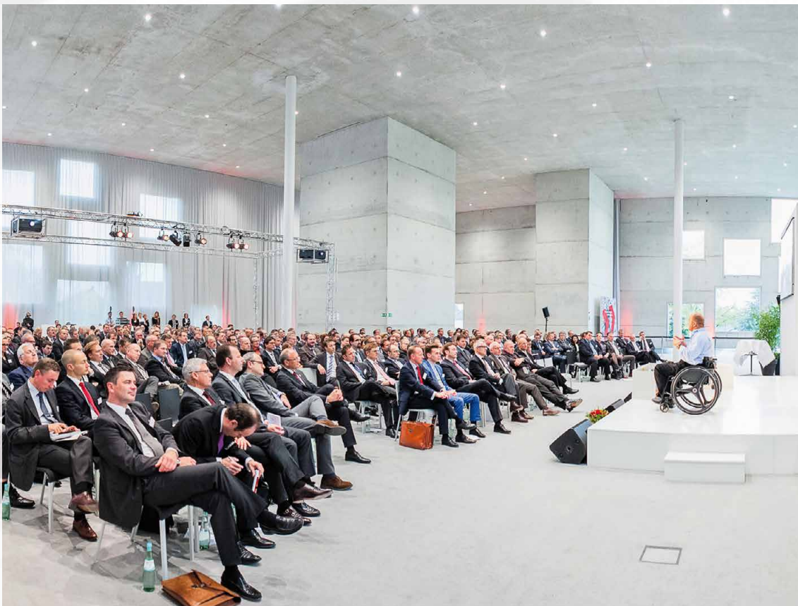
© Manuel Thomé i. a. Audi